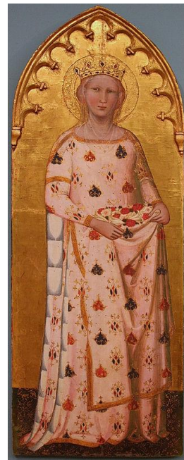
Pietro Nelli, 1365, den hellige Elisabeth af Thüringen

"Frygt ikke, for Jeg har løskøbt dig, Jeg kalder dig ved navn, du er Min. Går du gennem vand, er Jeg med dig, gennem floder, skyller de ikke sammen over dig; går du gennem ild, bliver du ikke forbrændt, flammen brænder dig ikke. For Jeg er Herren din Gud, Israels Hellige er din Frelser." Es43,1b-3a.